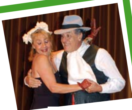
1, 2, 3, 4, 6, 7 y 8.: Diversos momentos de la inauguración y del espectáculo musical.

Cerca de 300 personas participaron en la presentación oficial del nuevo Centro del Teléfono de la Esperanza en Argentina