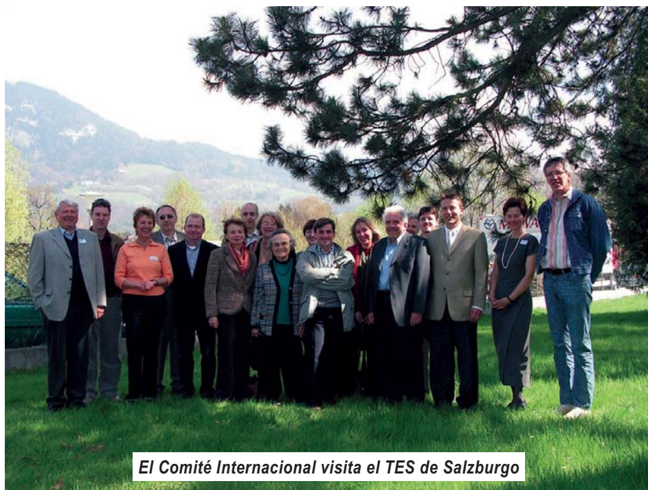
El Comité Internacional visita el TES de Salzburgo

El 14 de abril el Comité Ejecutivo también tuvo ocasión de encontrarse con todos los directores y representantes de los TES austriacos , quienes mantenían su reunión anual en Salzburgo ese mismo día. Esta reunión significó una muy buena ocasión de conocerse, presentar iniciativas y actividades de ambas organizaciones y de compartir opiniones acerca de los principales problemas con los que se enfrenta la Federación austriaca en estos momentos (vea el artículo de la página 3).